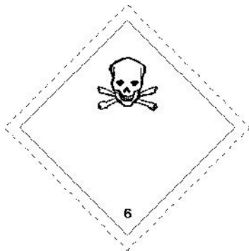
Rótulo Peligro Principal